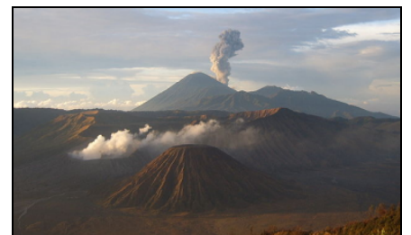
Des volcans sur l'île de Java en Indonésie

Cela se passe lorsqu'une plaque passe en dessous d'une autre plaque. Les éléments de la plaque qui plonge s'échauffent et se décomposent. Cela donne naissance à des laves acides et visqueuses. Le frottement de ces deux plaques engendre des fractures de la plaque supérieure et la remontée de magma. Ce sont des volcans de type explosif et ils peuvent former des îles. Ces zones de subduction donnent naissance aux volcans des Andes, du Japon, des Philippines, des îles indonésiennes (la « ceinture de feu » de l'océan Pacifique). Ce sont aussi des régions de séisme.